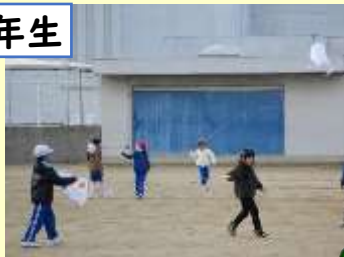
お正月の遊びを一緒に楽しんだね。