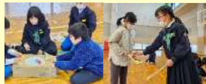
手作りおもちゃで昔遊び やゲームをしました。