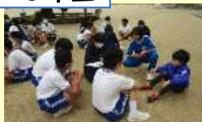
ジェスチャーゲームやポッチャ、 モルックで交流。